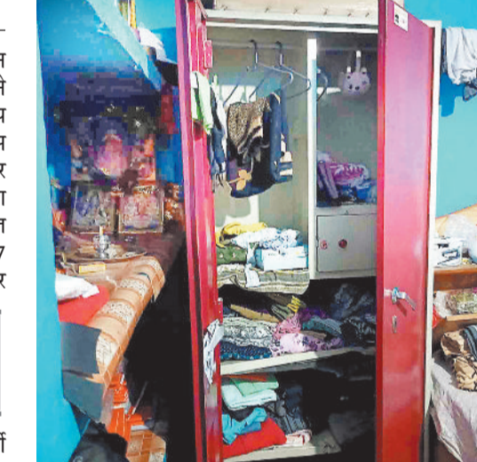
चोरों द्वारा तोड़ा गया आलमारी।